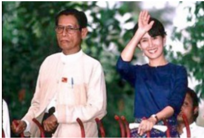
လွန်ခဲ့သည့် ၁၅ နှစ်က ဒေါ်အောင်ဆန်းစုကြည်နှင့်အတူ တွေ့ရသည့် ဦးတင်ဦး။ ယခုအခါ ၎င်းတို့ ၂ ဦးစလုံး ထိန်းသိမ်းခံနေရသည်။

အန်အယ်ဒီ ခေါင်းဆောင်တဦးဖြစ်တဲ့ ဒုတိယ ဥက္ကဋ္ဌ ဦးတင်ဦးဟာ လာမယ့် ရှေ့လ ဖေဖော်ဝါရီ (၁၃)ရက်နေ့ဆို နေအိမ်အကျယ်ချုပ် သက်တမ်း(၆)နှစ်ပြည့်မှာ ဖြစ်ပါတယ်။ နိုင်ငံတော်အေးချမ်းသာယာရေးနဲ့ ဖွံ့ဖြိုးတိုးတက်ရေးကောင်စီ နအဖ က နိုင်ငံတော်အား နှောင့်ယှက်ဖျက်ဆီးလိုသူများ၏ ဘေးအန္တရာယ်မှ ကာကွယ်သည့်ဥပဒေ ပုဒ်မ(၁၀)(ခ)နဲ့ မတရားအပြစ်ပေးအရေးယူခံထားရတာ ဖြစ်ပါတယ်။