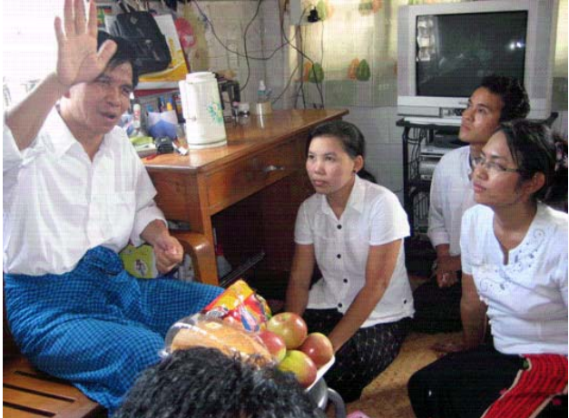
NLD လူငယ်များက အောက်တိုဘာ(၂)ရက်နေ့က ဥNအဖွဲ့ချုပ်မှ ဦးပုကျင်ရှင်းထန်နှင့် ဦးထောင်ကိုထန်းတို့ကို သွားရောက်ဂရုပြုကြပုံ။